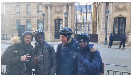
Sortie en vélo à Paris, ici, devant le palais de l'Élysée

« Je dis aux jeunes de la Cité: ne baissez jamais les bras. La Cité elle ne vous laisse jamais tomber.