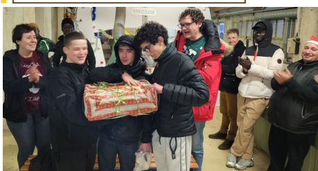
L'équipe gagnante des jeux de l'après-midi