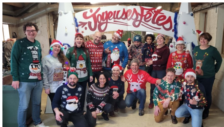
Le concours des pulls de Noël à la Cité le 22 décembre