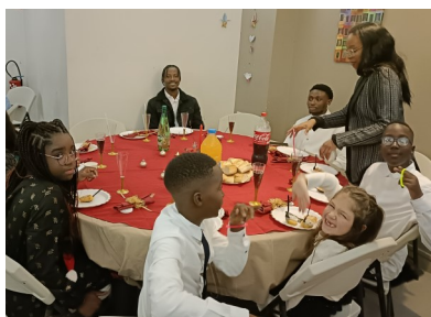
Le 24 au soir, dîner de fête et soirée dansante à Notre Dame de Montmélian !