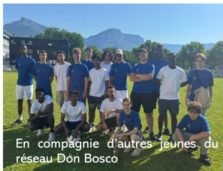
En compagnie d'autres jeunes du réseau Don Bosco

Entre les matchs de foot, de basket, les parties de pétanque, de badminton, les relais ou encore le molkky, le séjour a été rythmé par une multitude d'activités