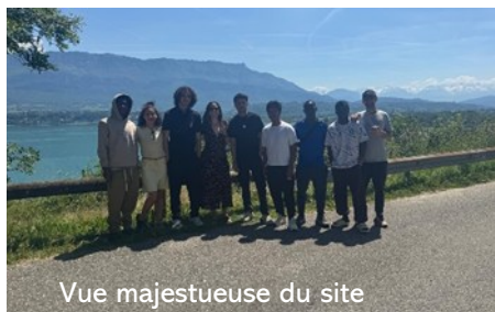
Vue majestueuse du site

« Ce week-end de la Pentecôte, sept de nos jeunes ont eu la chance de participer aux Bosc'Olympiques à Chambéry, ils en reviennent avec des souvenirs plein la tête !