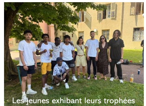
Les jeunes exhibant leurs trophées